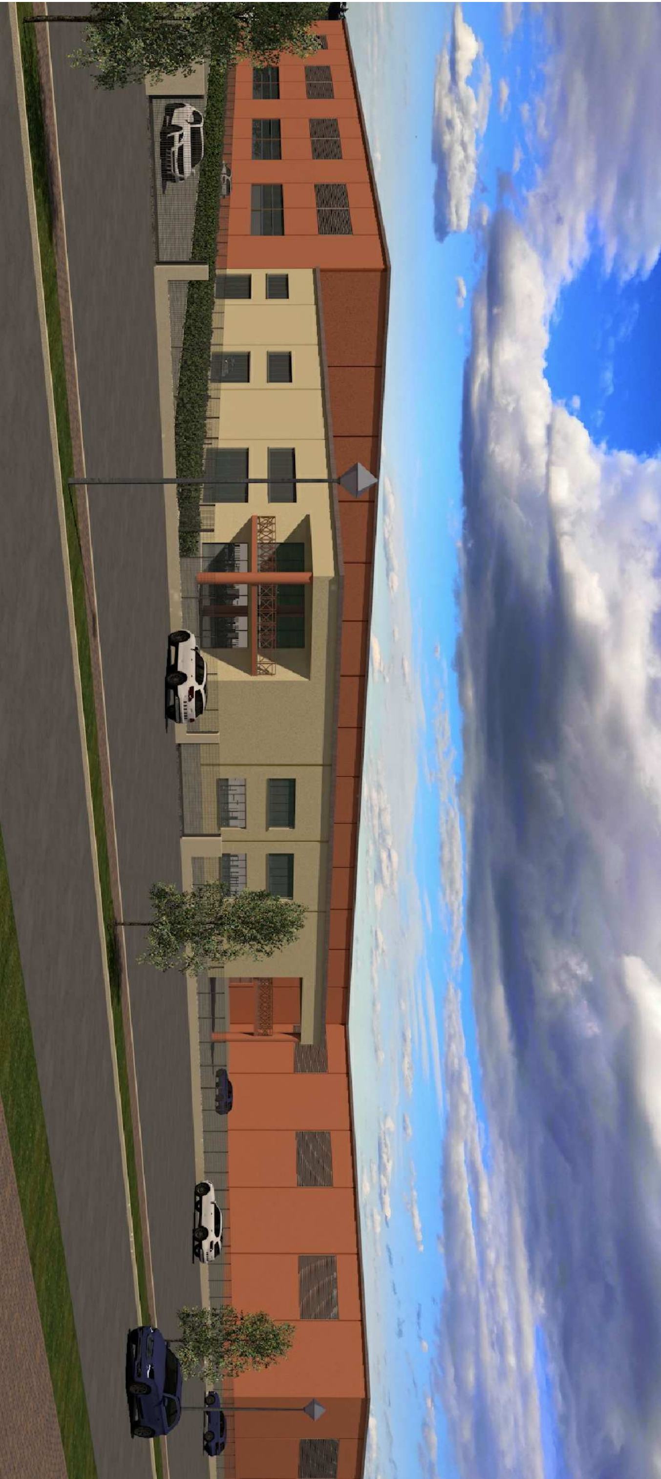
1– Vista da Sud–Ovest