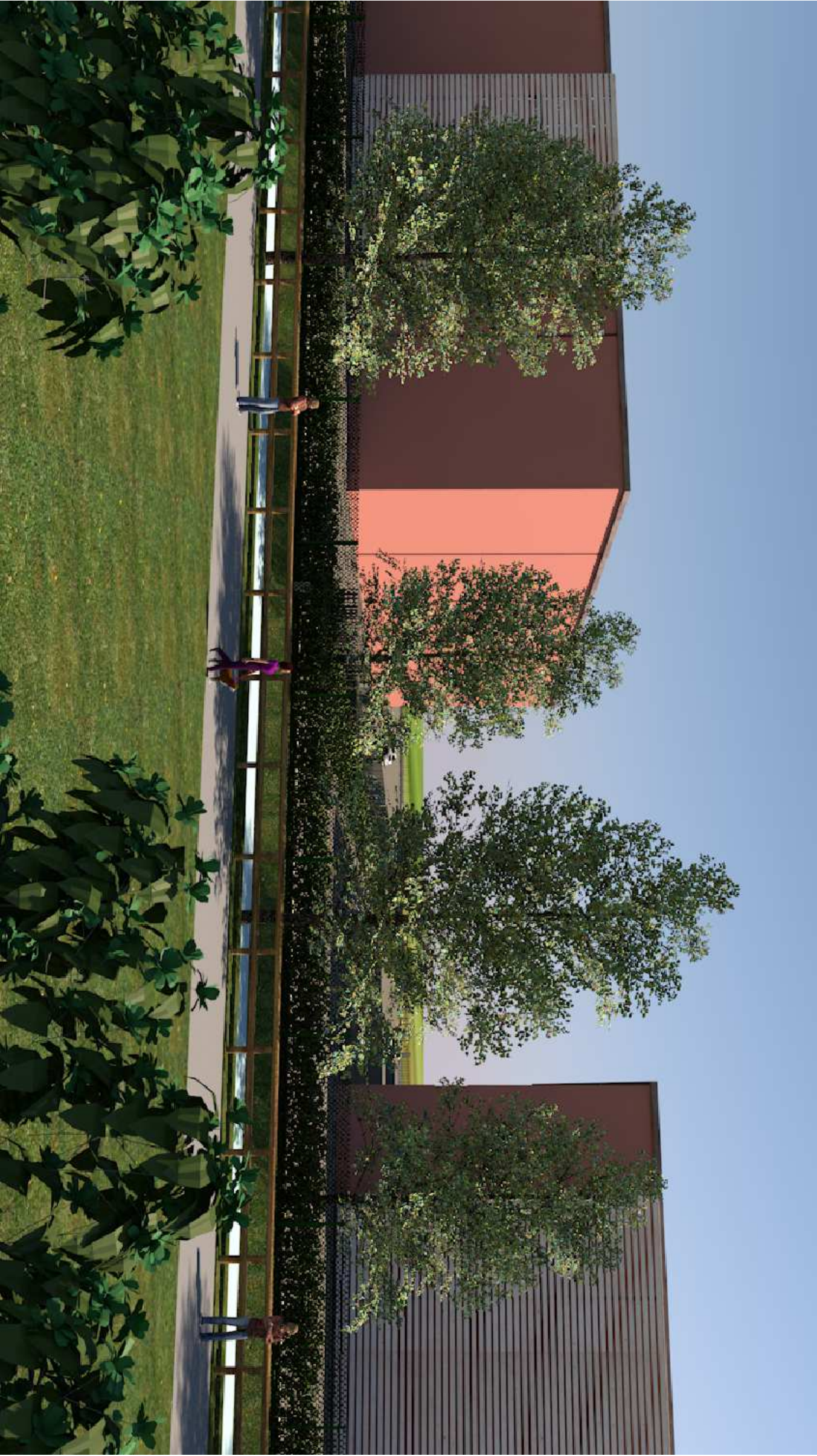
2– Vista cono prospettivo tra gli edifici